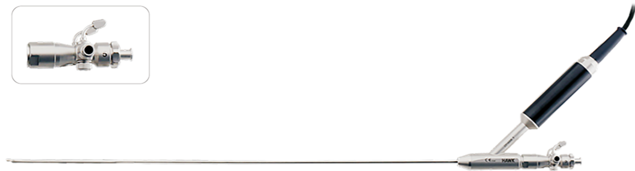
Video Uretero-Renoscop rigid