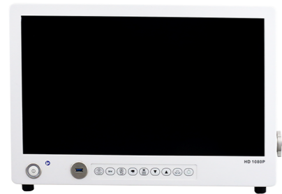
Platformă videoendourologie FullHD