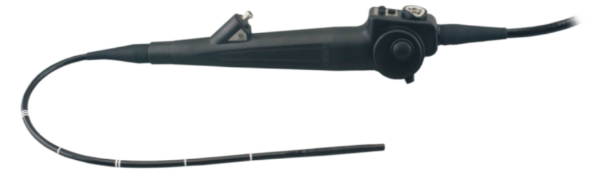
Video Cistoscop flexibil HD