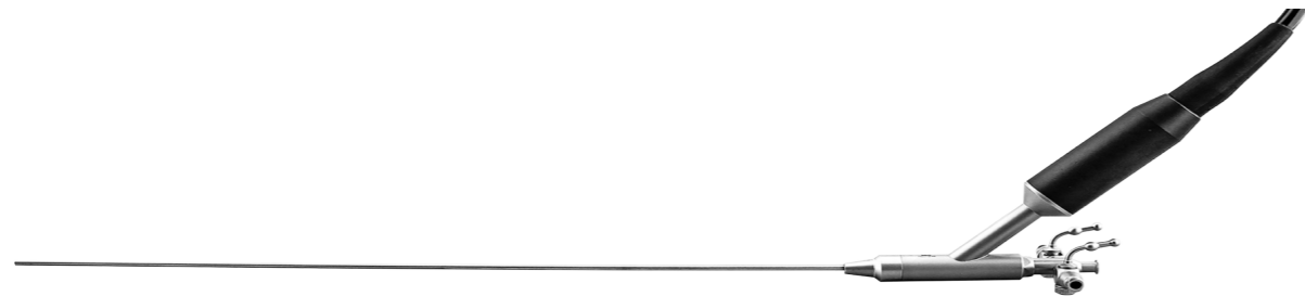
Video Nefroscop rigid