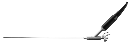
Video Nefroscop rigid