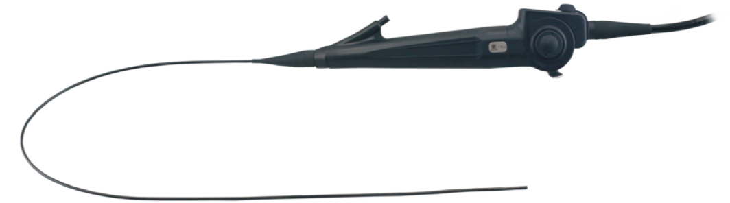
Video Uretero - Renoscop flexibil HD