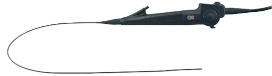
Video Uretero - Renoscop flexibil HD