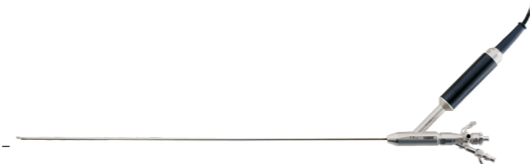
Video Uretero - Renoscop rigid